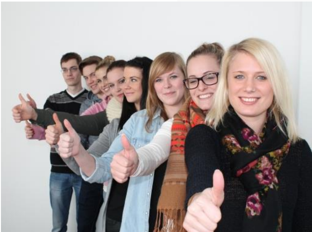
Fit for Future – Auszubildende der Demmel AG

Ethisch einwandfreies und verantwortliches Verhalten sind für unsere Arbeit ebenso grundlegend, wie der Respekt vor den Rechten jedes Einzelnen und dem Respekt gegenüber der Umwelt.