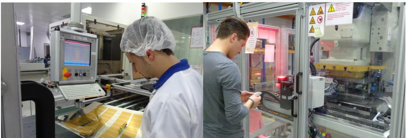
Wir sind stolz auf unser unschlagbares Demmel-Team

Alle Mitarbeiterinnen und Mitarbeiter halten sich ausnahmslos an geltende Gesetze und Verhaltenstandards sowie Geschäftsrichtlinien und Verfahrensweisen.