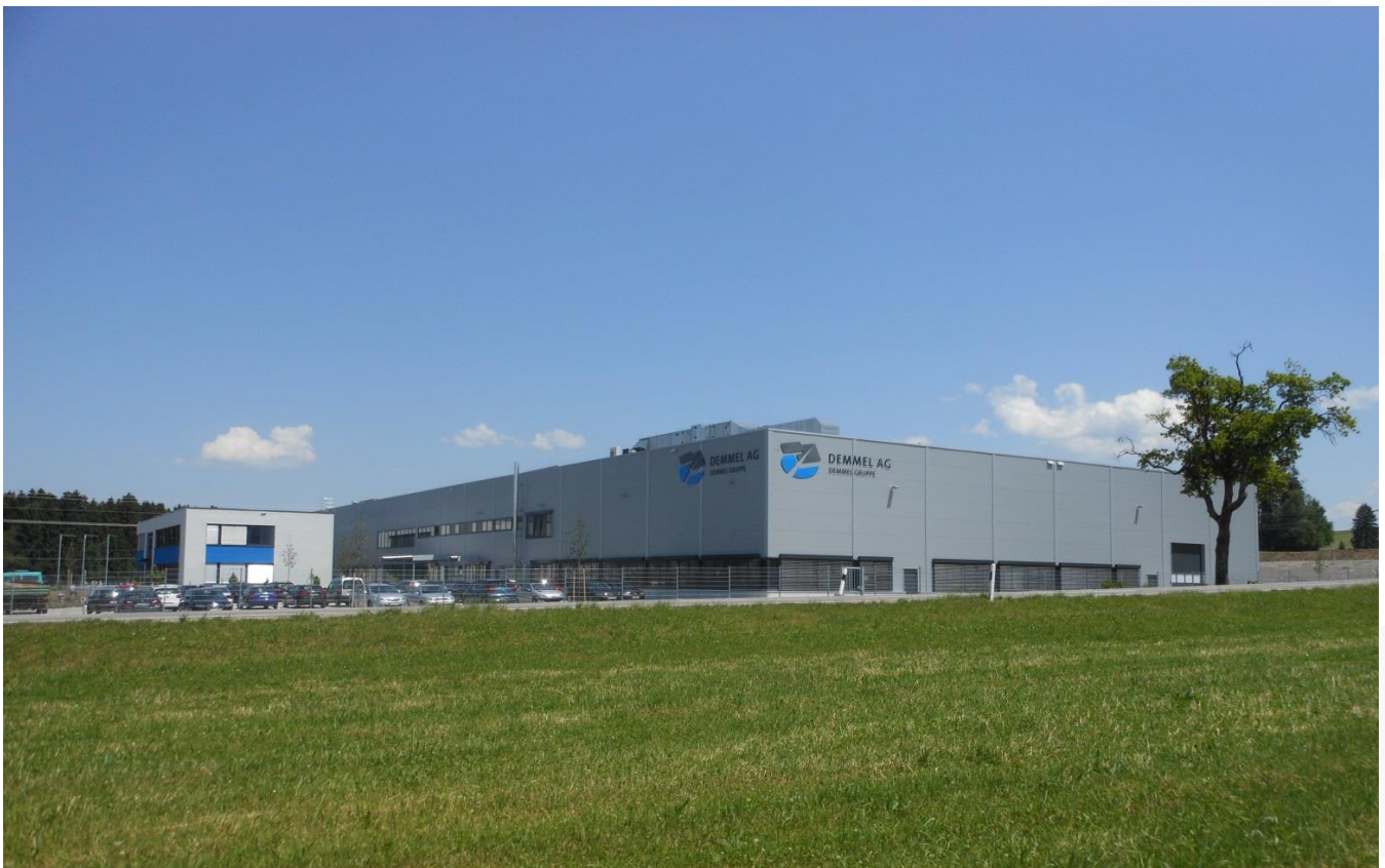
Demmel Werk-II im Westallgäu, Lindenberg,

Gemeinsam stellen wir uns den Herausforderungen, uns zu einem international tätigen und präsenten Unternehmen zu entwickeln. Nur als „Global Player“ werden wir uns zukünftig erfolgreich dem internationalen Wettbewerb stellen können. Dabei wollen wir weltweit als ein in unseren Branchen führendes Unternehmen gelten.